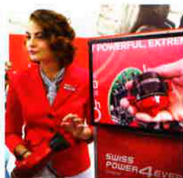
航太BLDC 無刷電機 工藝極緻細膩

「SP4」和「UP5.0」是搭載ENDURO BLDC 無刷電機，結合智能渦旋氣流技術，形成不可思議的強勁渦旋風，達到前所未有的速乾效率，大大提升50% 性能；你沒看錯，極耐用無刷核心壽命高達10,000 小時，而且低噪音、輕量化，堪稱地表最強大的吹風機，更具物超所值的魅力。