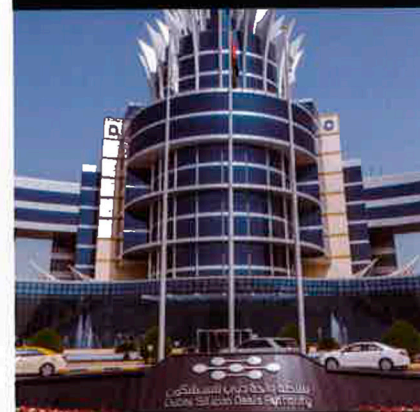
Valera 以法國作為海外銷售的處女地進軍全球市場，熱銷80多個國家，並於2015年在Valera市佔率高達90%的社拜，開設了第一家分公司。

堅持從設計、研發到製造都在瑞士完成，打造100%純正瑞士血統的 Valera 品牌，